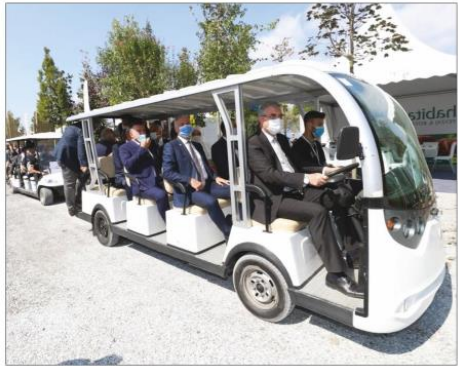
Açılış programının ardından festival alanı gezilerek çalışmalara ilişkin bilgiler alındı.