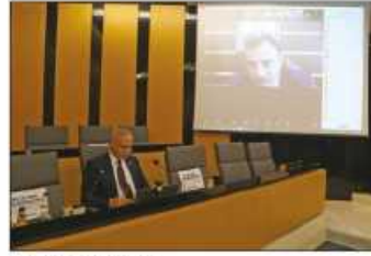
Plan güzel bir örnek"

"Şehrin vizyonunun oluşturulmasına Stratejik