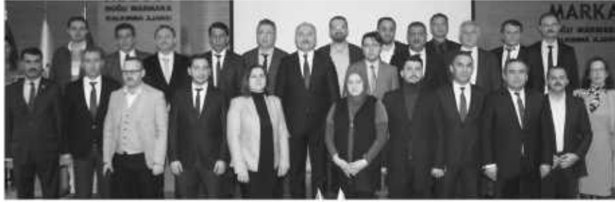
Destek alan 26 proje sahibi, törende toplu fotoğraf çekildi.