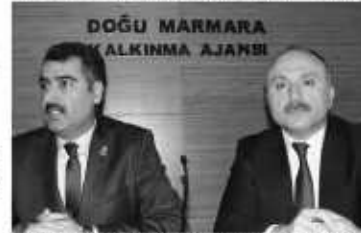
MARKA tarafından desteklenen projeler arasında Kocaeli İmam Hatip Liseleri Mezunları Derneği'nin Akıl ve Zeka Oyunları ile Bilişsel Gelişimi Destekleme projesi de var.