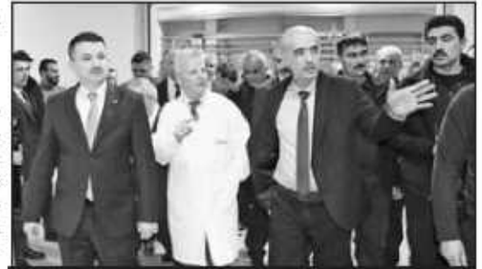
Tarım ve Orman Bakanı Bekir Pakdemirli, 2. Organize Sanayi Bölgesi'nde Suriyeli bir iş adamının kurduğu süt ürünleri fabrikasını ziyaret etti.