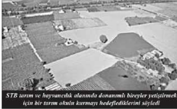
STB tarım ve hayvancılık alanında donanımlı bireyler yetiştirmek için bir tarım okulu kurmayı hedeflediklerini söyledi

" Sakarya Ticaret Borsası , Tarım Okulunun hayata geçmesiyle birlikte ülkemizde bütün atıl arazilere taliptir. Sayın Bakanımızda atıl arazilerin tarıma ve ekonomiye kazandırılması konusunda politikasını net bir şekilde dile getirdi. Cumhurbaşkanımızın talimatıyla başlayan bu çalışma bizleri mutlu etti" diye konuştu.