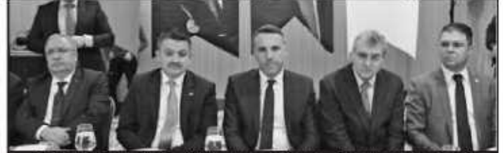
Pakdemirli, gerçekleştirdiği ziyarette, et piyasası, 31 mart yerel seçimleri hakkında açıklamalarda bulundu.

Sözü 31 Mart'ta yapılacak yerel seçimlere getiren Bakan Pakdemirli, bu seçimin çok önemli olduğuna dikkati çekerek, sözlerini şöyle tamamladı: "Demokrasinin, başkanlık sisteminin oturması için, gelecekte Türkiye'yi daha iyi noktada görmemiz için çünkü başkanlık sistemi herkese fırsat veriyor, hatta hayatta hiç iktidar olamayacağımızı düşündüğümüz muhalefet partilerine bile bu sistem fırsat veriyor, onlar da başkan olabiliyor. 100 yıllık bir demokrasimiz var, zaman zaman travmalar geçiriyoruz ve 2 sene önce de büyük travmamız oldu. Ondan daha önce de 17-25 Aralık'ı yaşadık. Bu sene ekonomik atak yaşadık. Bunların hepsini düşündüğümüz zaman, bugün