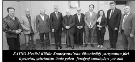
SATSO Meclisi Kültür Komisyonu'nun düzenlediği yarışmanın jüri üyelerini, şehrimizin önde gelen fotoğraf sanatçıları yer aldı