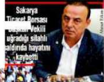
Sakarya Ticaret Borsası Başkanı Vekili uğradığı silahlı aldırıda hayatını kaybetti