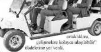
Oranıklardan, gelişmelere kolayca ulaşabilir" ifadelerine yer verdi.

Sarı, festivalle yönelik yaptığı konuşmada ise her şeyin Sakarya gibi verimli oyalan, Akova gibi verimli havzaları sahip olduğunun altını çizerek, "Böylesi festivaller, harika araçları ile hepimizin ihtiyaç duyduğu bilgi, birikim ve"