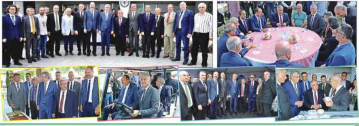
Peyzaj ve Süs Bitkiciliği Festivali'nin açılışında konuşan Büyükşehir Belediye Başkanı Ekrem Yüce, "Sakarya'yı süs bitkiciliğinde dünya markası haline getirmek en büyük hedeflerimizden birisi. İnşallah bu festival ile bu hedefimize biraz daha yaklaşıcağız" dedi.