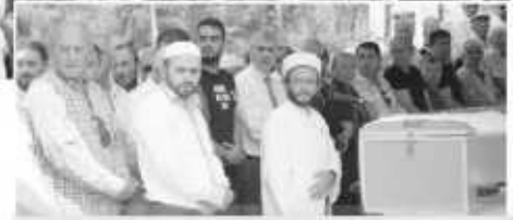
Cenazeye Vali Ahmet Hamdi Nayir, Büyükşehir Belediye Başkanı Ekrem Yüce, Hendek Belediye Başkanı Turgut Babaoğlu, STK temsilcileri ve çok sayıda seveni katıldı.