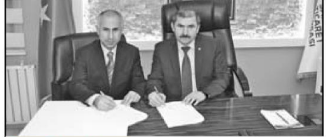
Sakarya Ticaret Borsası ve Sakarya Çalışma ve İş Kurumu İl Müdürlüğü ile 2017 yılında gerçekleştirilen 250 kişilik eğitim programı, bu yıl da devam edecek.

İlimizdeki girişimci sayısının artırılmasının desteklenmesi gerektiğine dikkat çeken