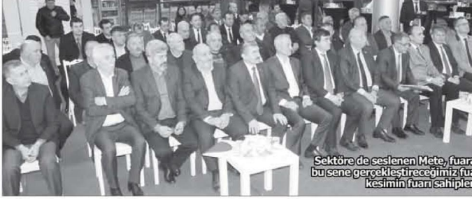
Sektöre de seslenen Mete, fuara sahip çıkılmasını isteyerek, "İlkini bu sene gerçekleştireceğimiz fuarımızı sürdürülebilir kılmak için her kesimin fuarı sahiplenmesini bekliyoruz" dedi.