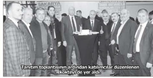
Tanıtım toplantısının ardından katılımcılar düzenlenen kokteyl'de yer aldı.